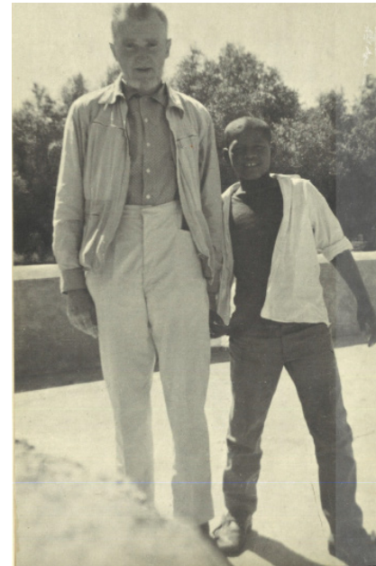
Jan Hanlo (1912-1969) en Mohamed (570-632)